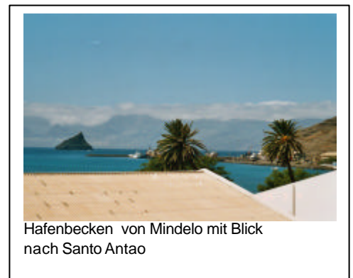
Hafenbecken von Mindelo mit Blick nach Santo Antao